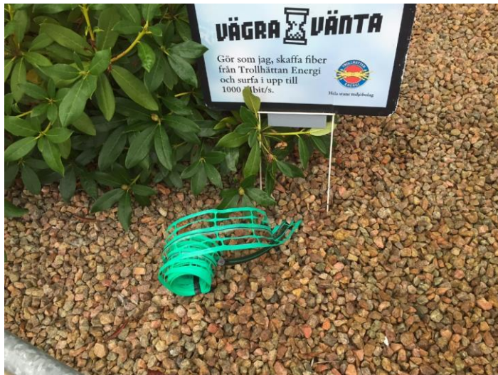
Fiberskylt i tomtragräns

Första steget är att skriva avtal med Trollhättan Energi. I samband med det gör din fiberförening ett hembesök hos dig. En skylt (bilden) sätts upp vid tomtragränsen för att markera var ni kommit överens om ingång för fibern på tomten. Samtidigt märker ni ut var fiberkabeln ska gå in genom husets grund/fasad (håltagningspunkten).