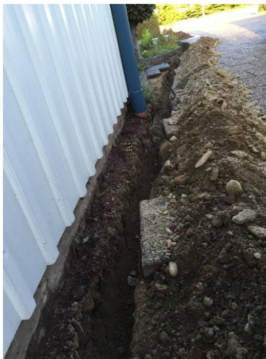
Exempel på schakt på tomt