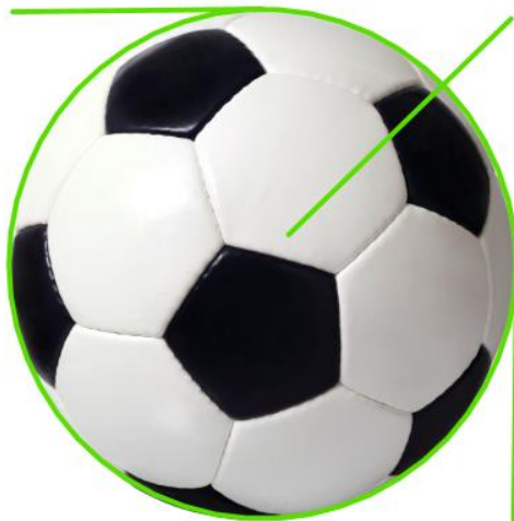
Svängradie för fiberslang